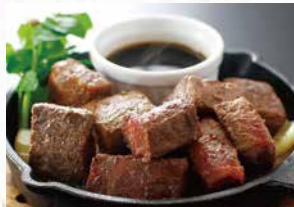
商品番号 商品名 NC-009 黒毛和牛 角切りステーキ 出荷日より冷凍30日