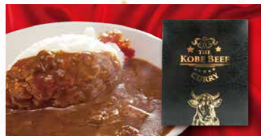
商品番号 商品名 NC-024 神戸ビーフカレー 製造日より常温2年