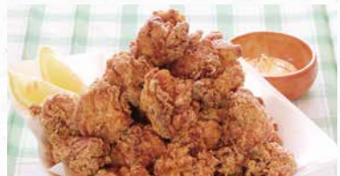
商品番号 商品名 NC-023 九州産 とり唐揚げ1kg 製造日より冷凍365日