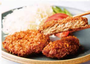
商品番号 商品名 NC-019 格之進 メンチカツ 製造日より冷凍180日