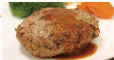
商品番号 商品名 NC-022 松阪牛 ハンバーグ 出荷日より冷凍30日

内容量 宮崎県産黒毛和牛生ハンバーグ100g×3個 国産合挽き生ハンバーグ100g×2個入×3袋/計9個