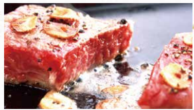
商品番号 商品名 NC-004 但馬牛 ももミニステーキ 出荷日より冷凍30日