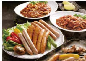
商品番号 商品名 NC-016 国産ポーク焼肉とソーセージセット 出荷日より冷凍30日

内容量 [焼肉]100g×4袋[ソーセージ]プレーン・ガーリック各90g×2袋、ハーブ90g×1袋/計5袋