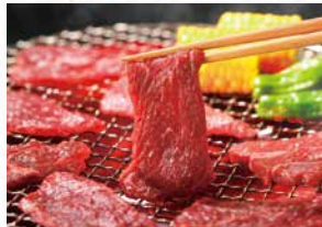
商品番号 商品名 NC-010 黒毛和牛 焼肉 出荷日より冷凍30日