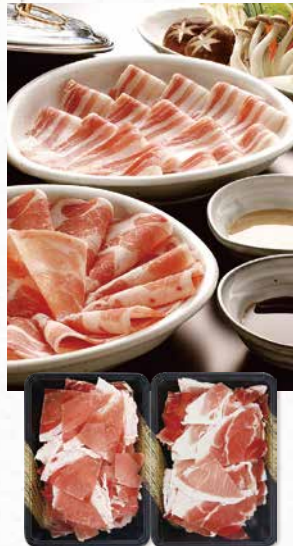
商品番号 商品名 NC-013 九州産 黒豚 特盛1kg 出荷日より冷凍30日