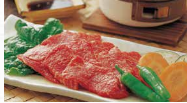
商品番号 商品名 NC-007 佐賀牛 焼肉 出荷日より冷凍30日