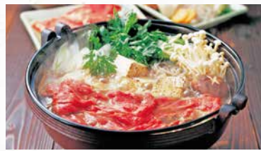
商品番号 商品名 NC-003 宮崎牛 すき焼き肉 出荷日より冷凍30日