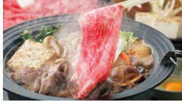
商品番号 商品名 NC-005 但馬牛 すき焼き肉 出荷日より冷凍30日