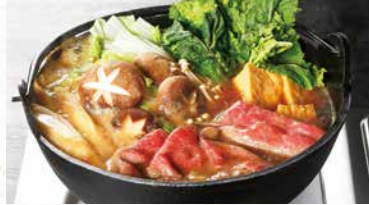
商品番号 商品名 NC-006 飛騨牛 すき焼き肉 出荷日より冷凍30日