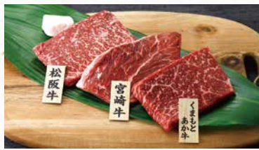
商品番号 商品名 NC-001 銘柄牛 ステーキ食べ比べ 出荷日より冷凍30日