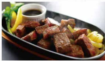
商品番号 商品名 NC-002 宮崎牛 角切りステーキ 出荷日より冷凍30日