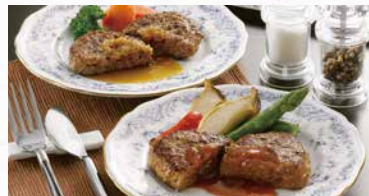
商品番号 商品名 NC-021 宮崎県産 黒毛和牛生ハンバーグと 国産 合挽き生ハンバーグ 出荷日より冷凍30日

内容量 宮崎県産黒毛和牛生ハンバーグ100g×3個 国産合挽き生ハンバーグ100g×2個入×3袋/計9個