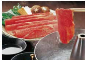
商品番号 商品名 NC-011 黒毛和牛 しゃぶしゃぶ肉 出荷日より冷凍30日