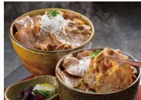
商品番号 商品名 NC-014 九州産 黒豚 生姜焼き丼の具 出荷日より冷凍30日