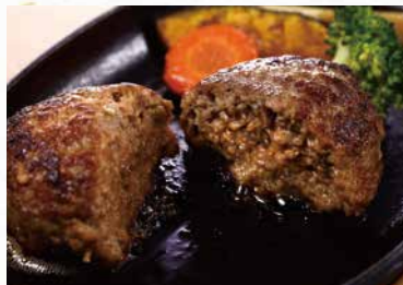
商品番号 商品名 NC-120 金格ハンバーグ&格之進メンチカツ 製造日より冷凍180日