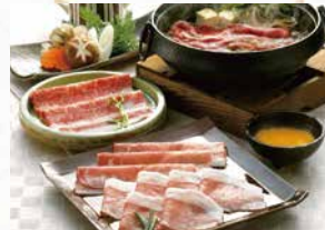
商品番号 商品名 NC-117 黒毛和牛と黒豚のすきやき肉 出荷日より冷凍30日

内容量 [焼肉]100g×4袋[ソーセージ]プレーン・ガーリック各90g×2袋、ハーブ90g×1袋/計5袋