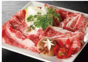
商品番号 商品名 NC-012 黒毛和牛 すき焼き肉 出荷日より冷凍30日