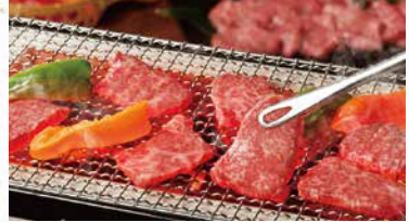
商品番号 商品名 NC-008 味彩牛 焼肉 出荷日より冷凍30日