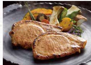
商品番号 商品名 NC-015 「祇園さ・木」 黒豚の金山すみぞ漬け 出荷日より冷凍30日